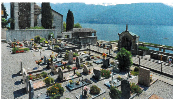
Il cimitero di Ponte, dove verranno trasferite le 400 salme