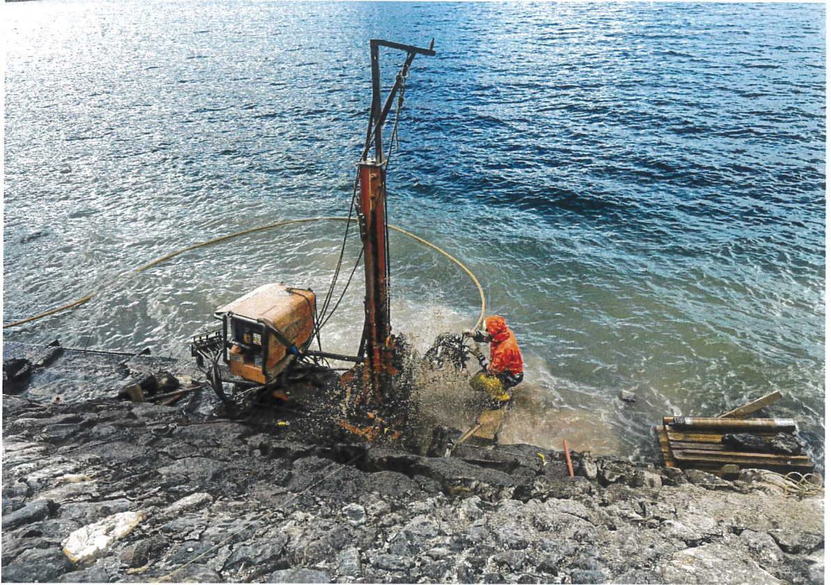
Foto 1 (cedimento della scogliera durante i lavori di perforazione)

In particolare, si è registrato il collasso della vecchia banchina di fondazione durante le opere di palificazione (foto 1 e 2). Questo cedimento ha causato costi supplementari, sia per la conseguente necessità di dover rinforzare ulteriormente l'armatura di fondazione tramite la saldatura di rinforzi metallici (foto 3), sia per la successiva ricostruzione della scogliera da parte dell'impresa di costruzioni (foto 4).